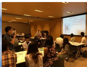
近畿大学建築ワークショップ